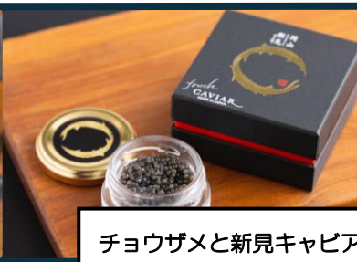
チョウザメと新見キャビア（鱒鮫屋MSファーム）