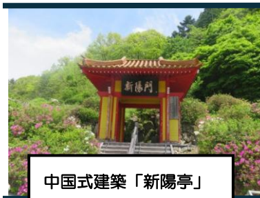
中国式建築「新陽亭」